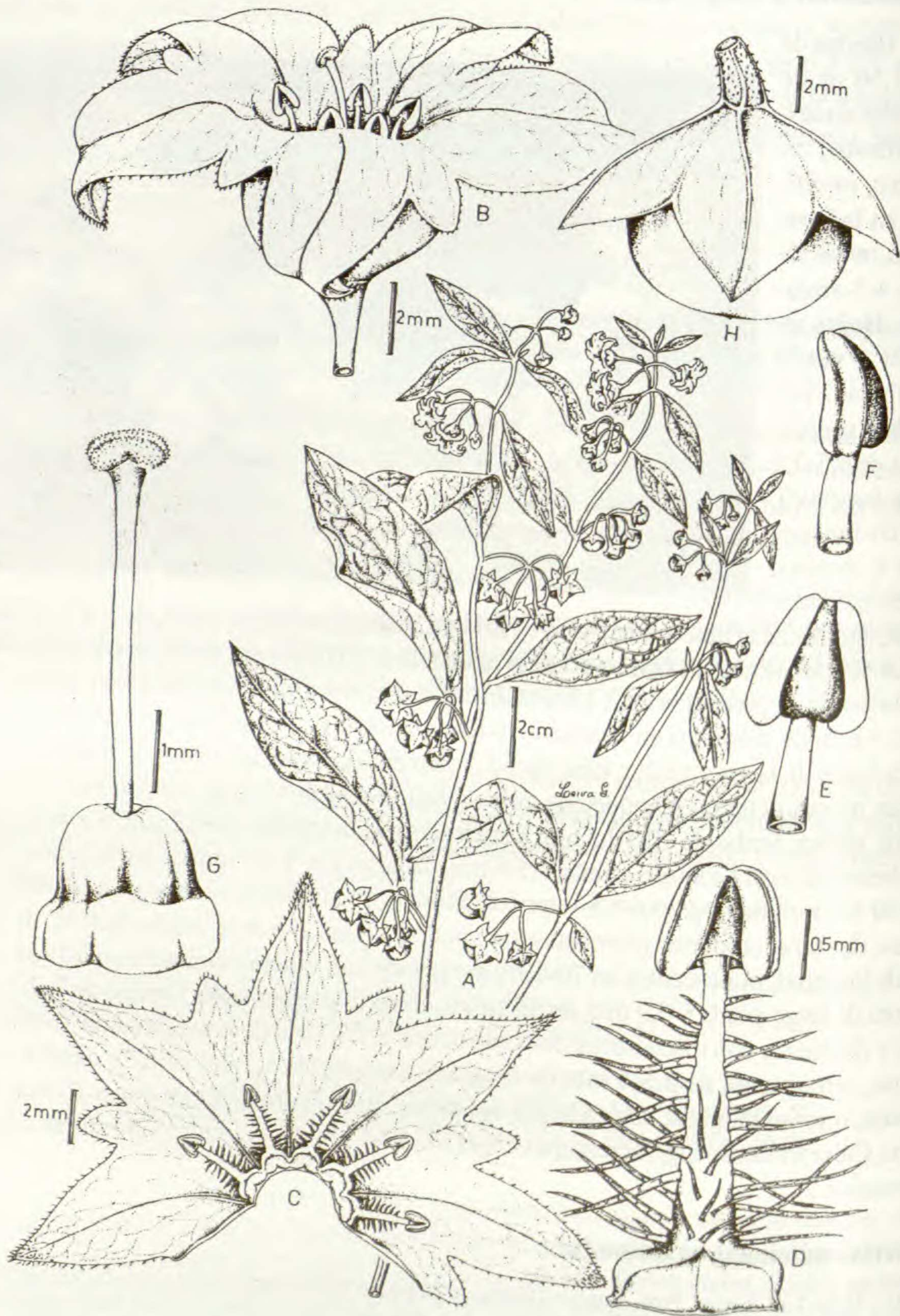
Fig. 4. Jaltomata mionei Leiva & Quipuscoa: A. Rama florífera; B. Flor; C. Corola desplegada; D. Estambre (vista ventral); E. Estambre (vista dorsal); F. Estambre (vista lateral); G. Gineceo; H. Baya. (del. de S. Leiva 1691, HAO).